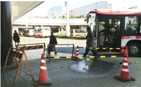
雨漏りを避けながら歩く駅利用者

泉区長 泉中央駅が開業して17～18年経過した頃から路面の損傷や雨漏りなど老朽化が進み、計画的な改修を行おうとした矢先に、震災によりさらにデッキの継ぎ目にあたるエキスパンションジョイントや排水装置、床面タイル等が損傷したものです。